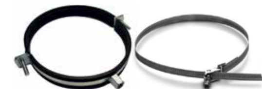
Beugels met rubber en spanbanden

Grote maten verkrijgbaar op aanvraag (zowel rond als rechthoekig)