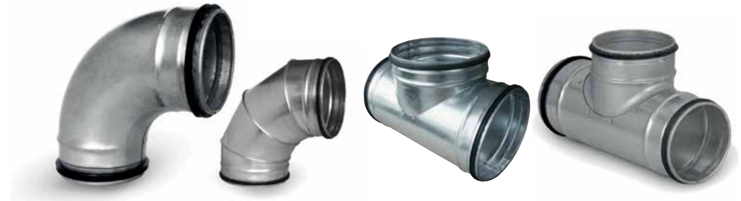
Bochten met rubberen dichting

Hulpstukken en toebehoren te verkrijgen van Ø 80 t/m 500