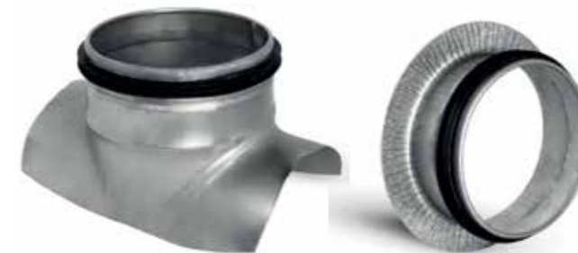
Ronde/platte aftakkingen (zadelstuk) met rubberen dichting