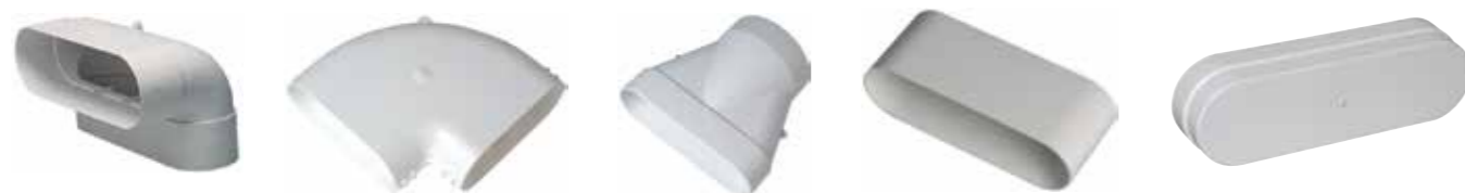
Minigaine PVC hulpstukken 40 x 100mm eq. Ø 80mm en 60 x 200mm eq. Ø 125mm