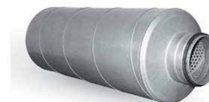
Geluidsdemper 50mm isolatie met rubberen dichting