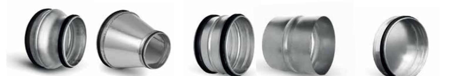
Reducties concentrisch met rubberen dichting