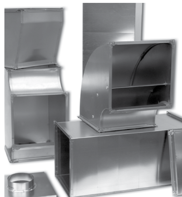
Rechthoekig op maat

Hulpstukken en toebehoren te verkrijgen van Ø 80 t/m 500