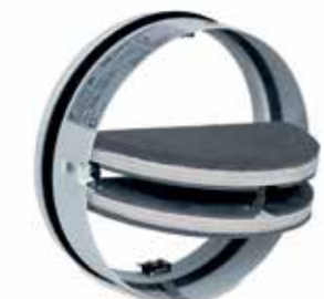
Ronde brandwerende vlinderkleppen